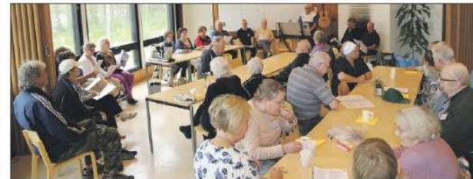
Tapahtumassa laulettiin myös yhteislauluja Eläkeläisten Iloisten laulajien toimiessa esilaulajina ja säestäjinä.